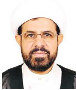
الشيخ د. مجيد العصفور

قال الشيخ الدكتور عبدالمجيد العصفور لا يجوز الإجهاض شرعاً إلا في حالة أن يشكل الجنين خطراً جدياً على حياة الحامل، وقبل أن تلج فيه الروح، أي قبل إكمال الجنين الشهر الرابع، أما بعد ذلك فلا يجوز مطلقاً، ويتحمل من يقوم بعملية الإجهاض الدية والكفارة حتى لو إذن له الولي أو المرأة الحامل.